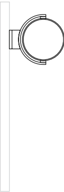
SUN MEDIUM floodlight on pole

size floodlight h 399 mm pole h 12 meters